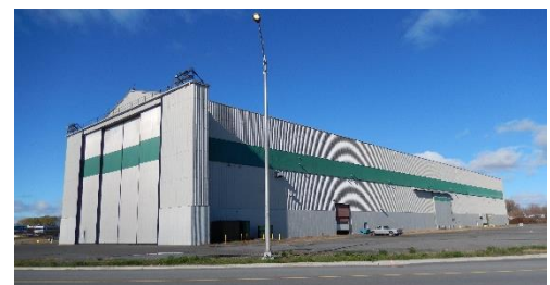
Usine de bogies d'Alstom inc