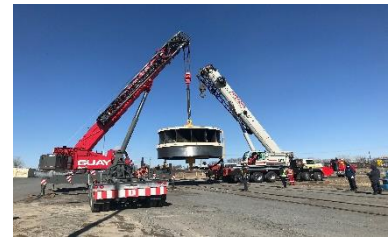
Transfert d'une turbine - GE

Le PILS est desservi par la voie ferrée du CN, ces installations sont au nord-ouest du site. Comme les quais, les entreprises qui opèrent sur le site de la SPIST peuvent avoir accès à ces installations. L'arrivée de Stella Jones inc a occasionné une réfection importante de la voie la plus au nord-ouest (B-641). L'utilisation des voies ferrées a grandement augmenté en 2021 réduisant ainsi le camionnage sur le site.