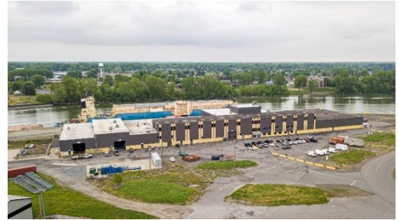
PILS 1800 Émile-Bernard

Le bâtiment sis au 1800, rue Émile-Bernard, est le bâtiment principal détenu et géré par la SPIST. Cet édifice de 3 étages est utilisé à presque 100 % de sa superficie utile. Le rez-de-chaussée est occupé par des ateliers à 80 % et par un bel espace de bureaux. Le deuxième étage a quelques espaces de bureaux qui sont tous utilisés. Alors que le dernier étage est en partie utilisé pour du rangement. Des travaux importants seraient nécessaires pour permettre une utilisation optimale.