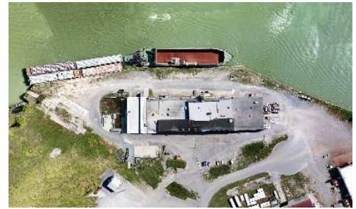
Quais 10 et 11