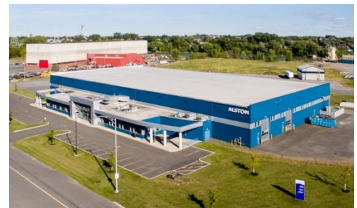
Usine de bogies d'Alstom inc – crédit photo Pascal Gagnon